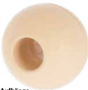
für Aufhängekette mit Gliedstärke max.